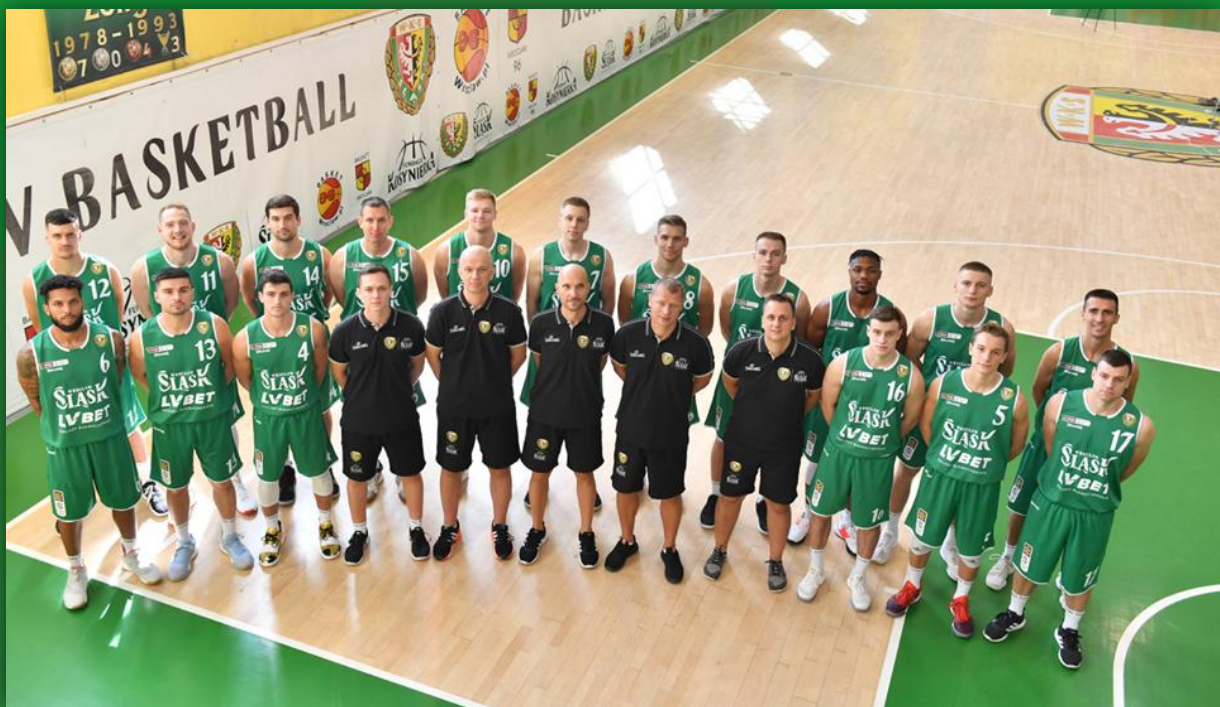
WKS ŚLĄSK WROCLAW 2019/2020